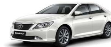
070 White Pearl CS