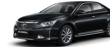
1H2 Dk. Steel MC