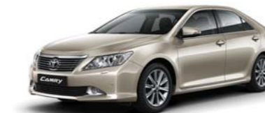
4T8 Beige ME