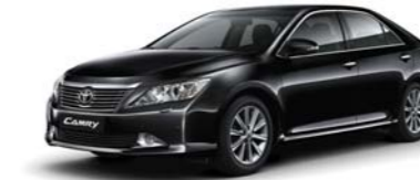
218 Altitude Black MC