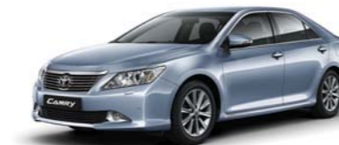
8W1 True Blue M.M.