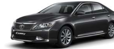
1G3 Gray ME