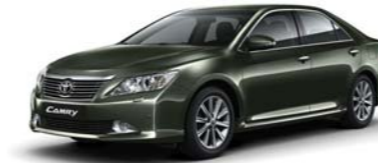
6T7 Olive M.M.