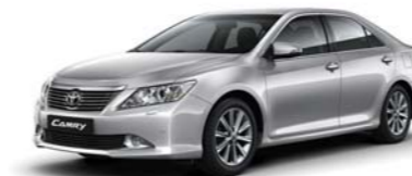
1F7 Silver ME